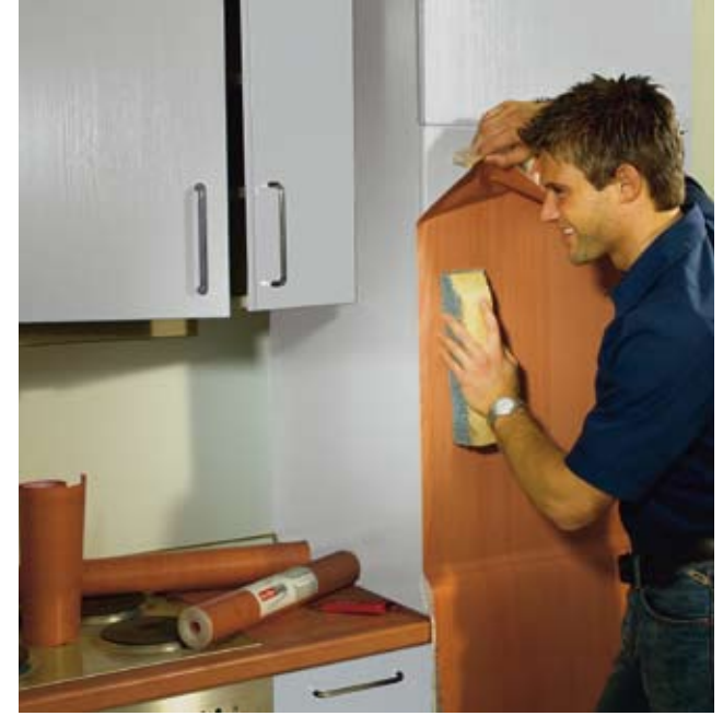
Einfach perfekt. Die Holz- und Marmor-Folien

Das Rezept für echte „Gourmets“: Eine Kombination aus Holz und Marmor. Die Wirkung ist verblüffend: Alte Arbeitsflächen, Fronten und sogar der Kühlschrank werden wie neu. So wird die Küche ohne großen Aufwand zum Lieblingsraum – und das Kochen bereitet noch mehr Freude.