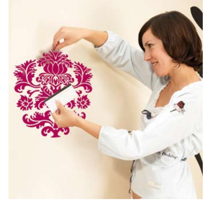
SPiRiT Neu und kreative dekorieren

Wenig Aufwand und große Wirkung: das ist deco spirit. Die selbstklebenden Elemente bringen trendiges Design in jeden Raum. Einfach aufzubringen und wieder abzulösen. Im Nu ein frisches Styling für jeden Raum.