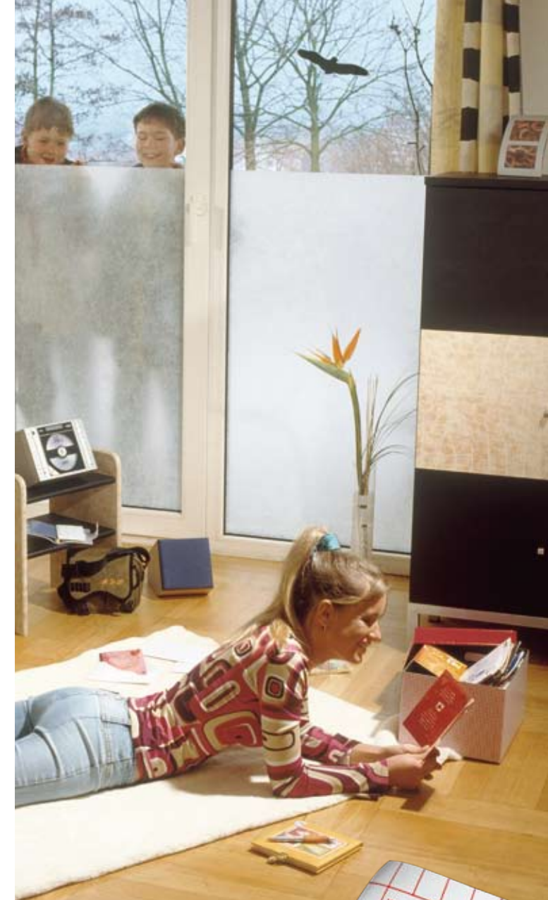
Blickfang mit großer Wirkung Sichtschutz mit Transparentfolien